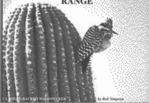
LADDER-BACKED WOODPECKER by Rob Simpson