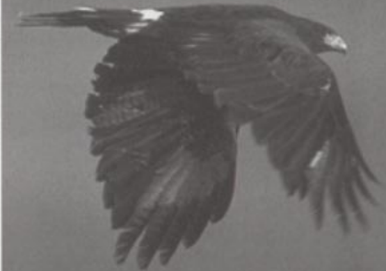
HARRIS' HAWK By Bill Cook